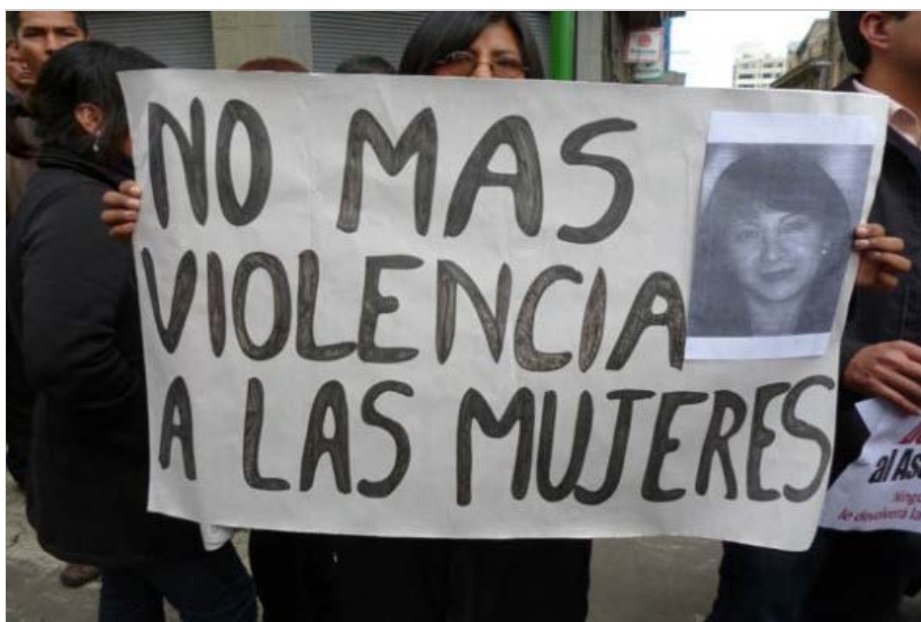
Manifestantes muestran un cartel en contra de la violencia a mujeres.